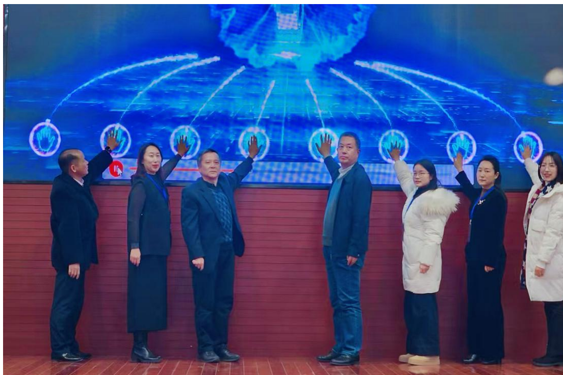
图 3-4 护理系参加智慧康养国际标准专业共建