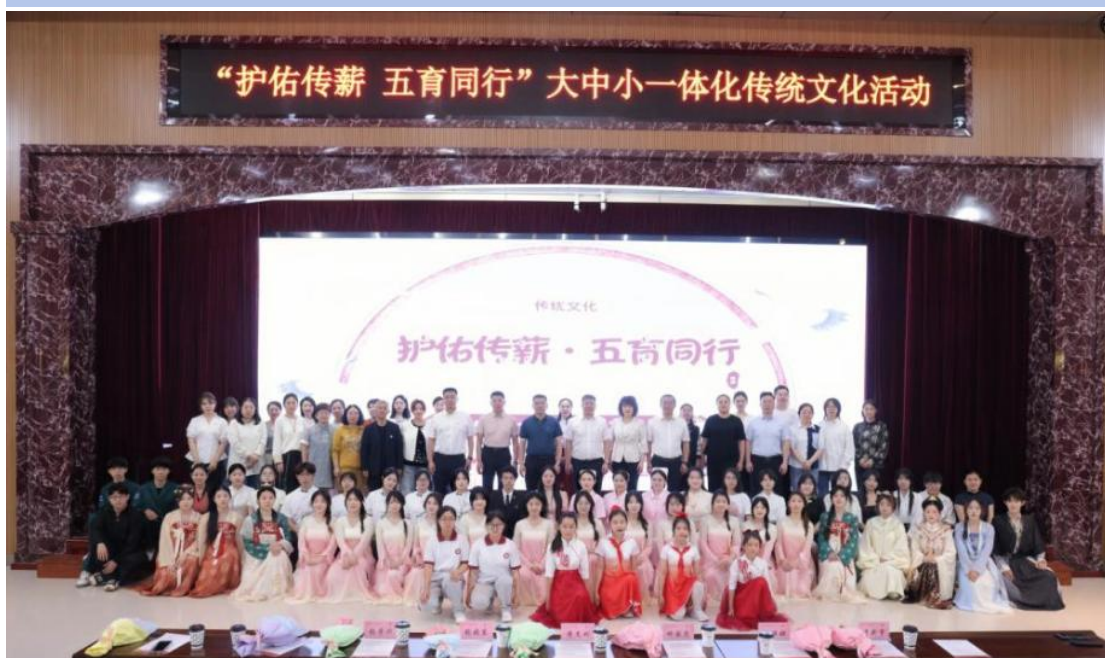
图 2-14 “护佑传薪五育同行”大中小一体化传统文化活动

学校在阿城校区成功举办“护佑传薪五育同行”大中小一体化传统文化主题活动，以打破教育阶段壁垒、传承中华优秀传统文化为核心目标，构建沉浸式育人场景。活动内容丰富多元、特色鲜明，设置中药茶饮调制、古法扎染技艺、传统香囊制作等非遗工坊体验项目，让师生与家长近距离感受传统技艺的魅力；创新开设融合《孝经》经典解读与中医康养护智慧的“孝道文化”微课堂，搭配传统歌舞表演、民乐演奏及亲子趣味体育游戏等环节，实现“文化体验+知识传授+互动参与”有机结合。此次活动以沉浸式、互动式传播方式，搭建起“高职引领—中学衔接—小学启蒙”的一体化育人链条，推动职业教育专业特色与传统文化深度融合。