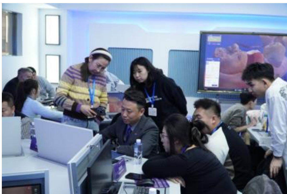
图 4-5 口腔医学系承办牙科技术大师讲堂德国 exocad®ICTC 中国高级培训班

学校深化工匠精神培育，以“引进行业名师、搭建传承平台”为核心，强化大师引领作用。邀请临床专家、技能大师进校园，通过专题讲座解读行业前沿技术，结合临床案例开展实操指导，将一线临床经验与职业精神传递给师生。同步依托学校五大专业群，建立5个“大师工作室”，聚焦老年护理、急危重症处置、中医康养、口腔健康、医学诊疗等领域，开展师徒结对、技术攻关与教学研讨活动。工作室不仅成为技能传承的重要载体，更推动行业标准与教学实践深度融合，助力师生在近距离学习中感悟匠心、提升技艺，为培养高素质护理人才提供有力支撑。