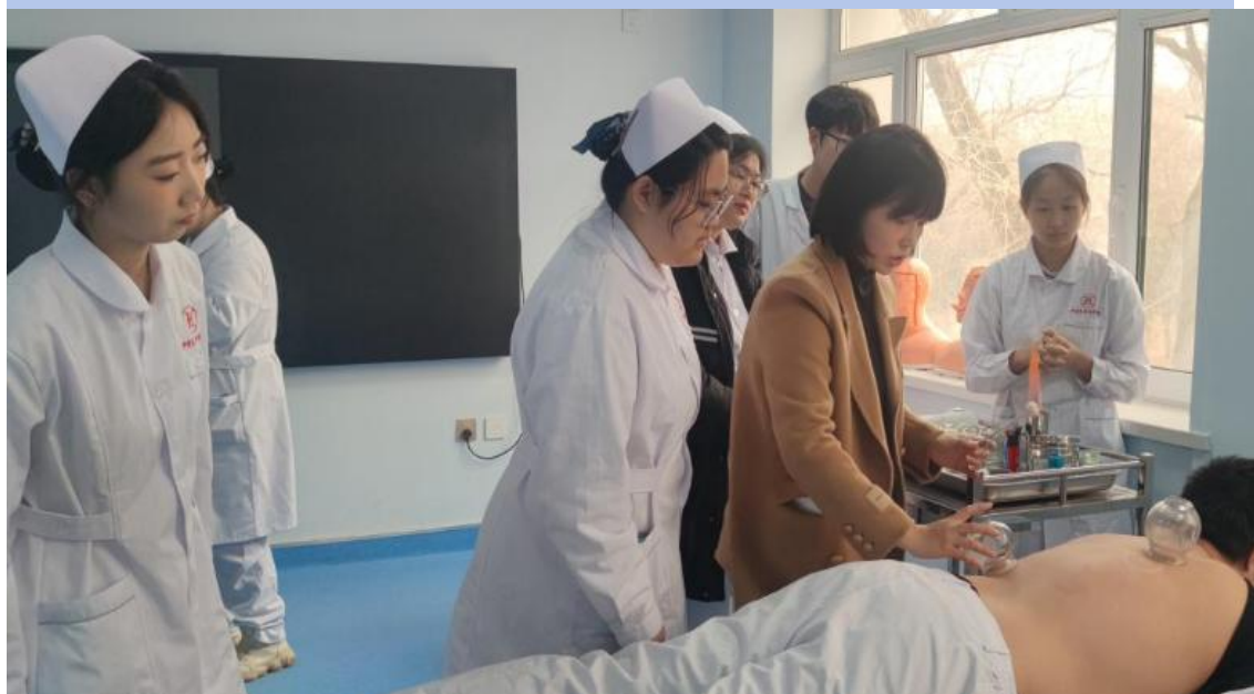
图 4-12 护理系与阿城区中医医院共同组织开展“中医护理技术走进校园系列讲座”

宽了就业视野与机遇，更通过“文化浸润+技能传授”的模式，提升了学生健康素养与中医护理实践能力，为高素质护理人才培养注入传统文化内涵，深化了产教融合育人成效。