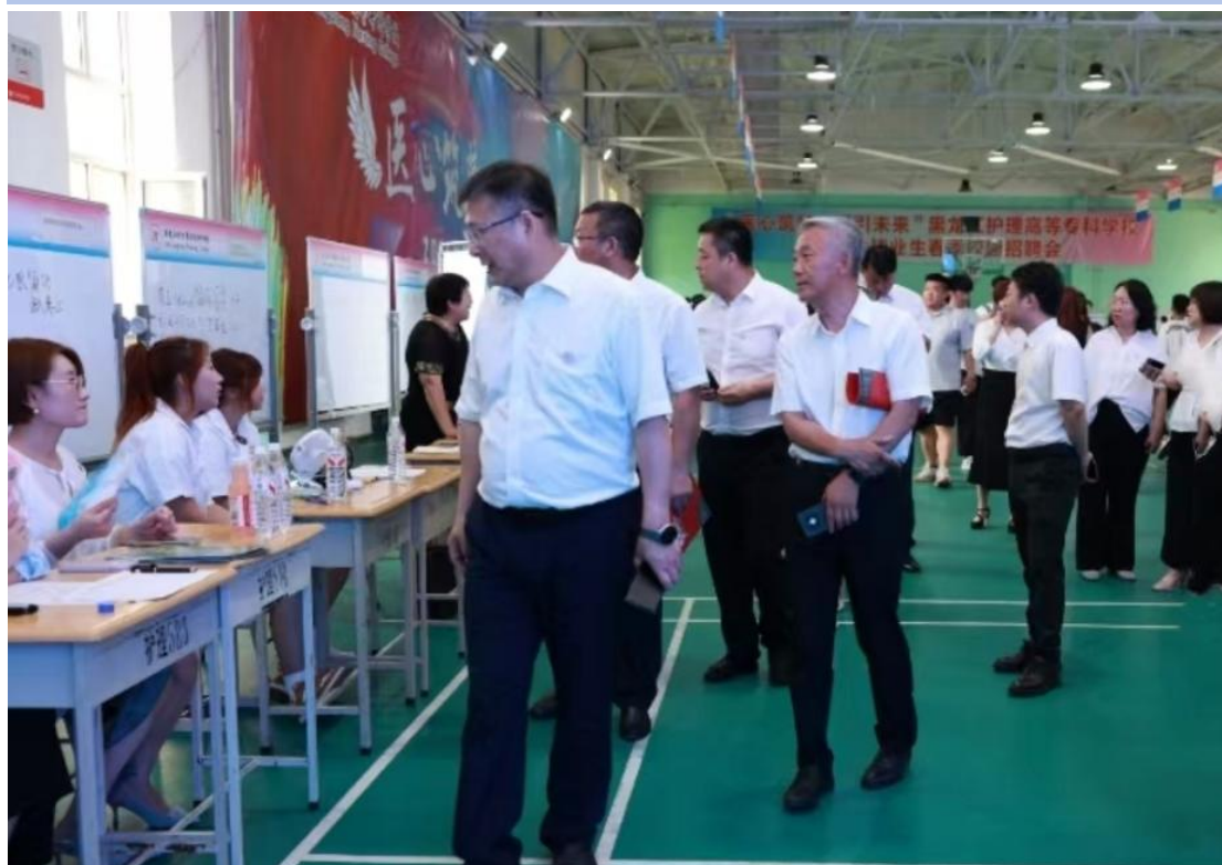
图 2-8 校领导查看招聘情况

对接龙江医疗卫生事业发展需求，邀请 50 家省内外优质用人单位参会，覆盖全科医学、康复康体、医学检验、护理等多个核心领域，累计提供近 600 个高质量就业岗位。招聘会现场科学划分政策宣传、应征入伍咨询、企业洽谈、简历指导等功能区域，校领导亲临现场与企业负责人深度沟通，精准对接用人需求，深化校企合作共识。此次专场招聘会搭建了毕业生与省内用人单位高效对接的桥梁，不仅为学子留省就业、扎根基层提供了广阔平台，更有效助力基层医疗人才队伍建设，为振兴龙江医疗卫生事业注入新鲜血液，进一步完善了“校院协同、精准赋能”的就业服务体系。