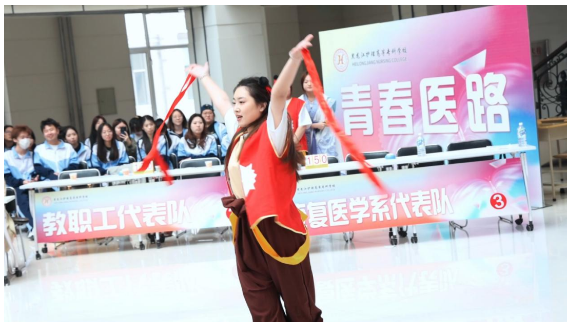
图 4-11 学校“青春医路·文化兴校”知识竞赛比赛中选手表演

展通过药材标本展示、经络穴位体验等形式，直观呈现中医药文化魅力。活动部分展品与边疆常见中药材、寒地养生方法相关，既丰富了校园文化生活，又让师生在沉浸式体验中深化对传统文化的认知。