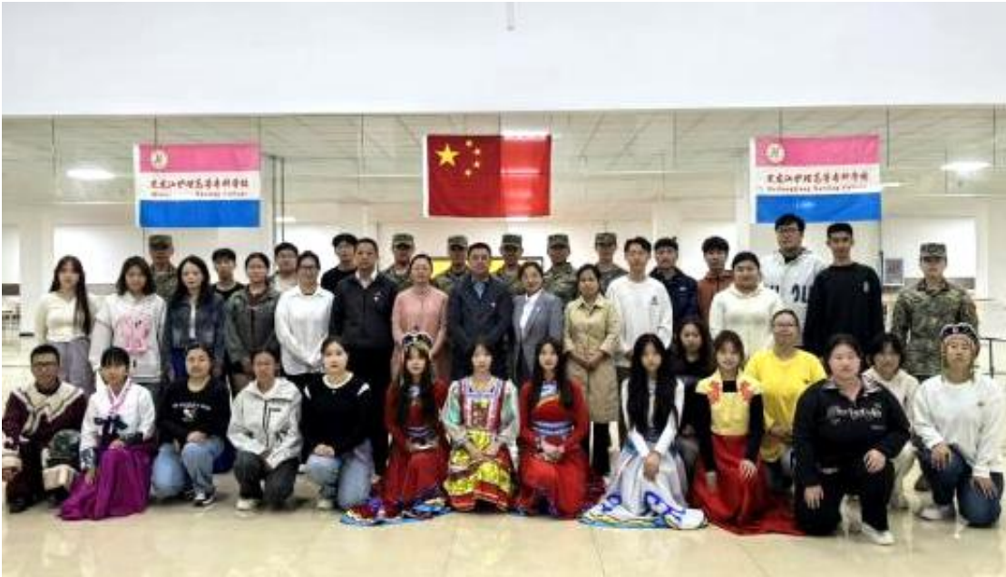
图 5-1 黑河校区民族文化交流暨军民同心共建活动

学校与黑河市人民政府签约共建黑河校区，2025 年秋季正式启用并迎来首批 450 名新生。校区聚焦边境医疗健康需求，开设护理、康复治疗技术、中医康复技术 3 个特色专业，填补了黑河市及周边区域卫生健康类高职教育空白。校区的建成不仅拓展了学校办学空间，更搭建起面向东北亚的卫生健康人才培养平台，为中俄跨境医疗健康合作、区域医疗卫生事业发展注入新动能，实现教育惠民与开放发展双向赋能。