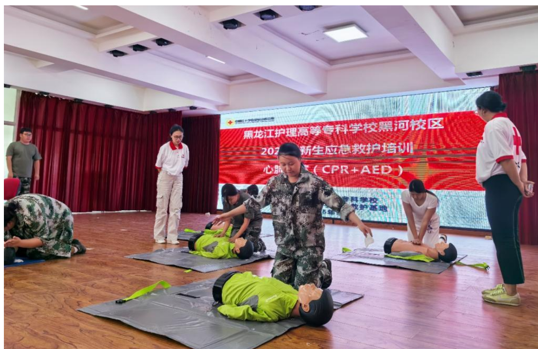
图 4-7 学校黑河校区开展第 26 个“世界急救日”边境应急救护培训

山病防治、边疆医疗支援等真实历程，生动诠释“扎根边疆、服务人民”的龙江精神内涵。结合“双高”建设中“康养护”专业群育人目标，将宣讲内容与学生职业理想教育结合，引导学子从龙江医疗奋斗故事中汲取力量，树立“守护边疆健康”的职业信念，让龙江优秀精神成为校园文化的鲜明底色。