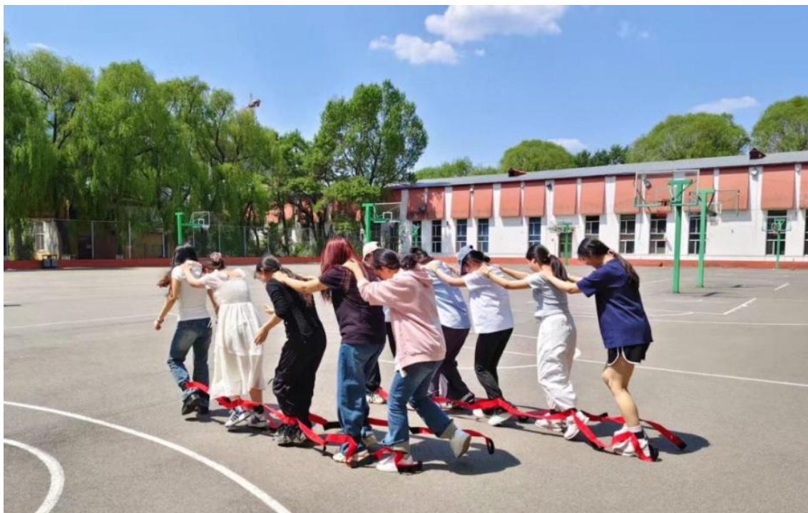
图 2-6 团队协作活动现场