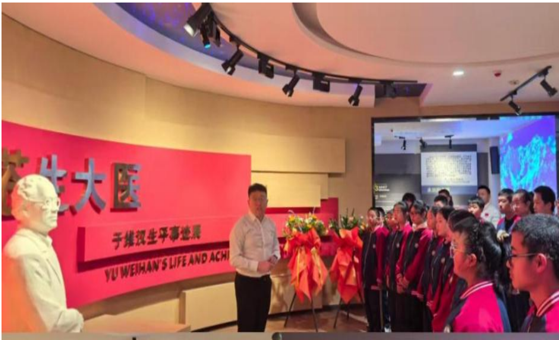
图 2-4 学生代表在学校于维汉纪念馆认真聆听讲

学校于维汉纪念馆精心组织开展主题研学活动，接待阿城区第九中学学生代表沉浸式感悟科学家精神。活动中，讲解员带领学子有序参观馆内珍贵展品、文献资料与实物陈列，生动讲述于维汉院士扎根东北边疆、毕生攻克克山病、守护人民健康的感人事迹，让青少年直观领略“心系人民、胸怀祖国、严谨治学、甘于奉献”的科学家精神内核。研学尾声，学校为每位学生送上承载殷切期许的定制书包，将精神传承与成长激励深度融合。此次活动既充分发挥了纪念馆的社会教育与文化传播功能，更以沉浸式体验让科学家精神直抵青少年心灵，助力学子树立远大理想、涵养家国情怀，切实推动科学家精神进校园、润童心、育新人。