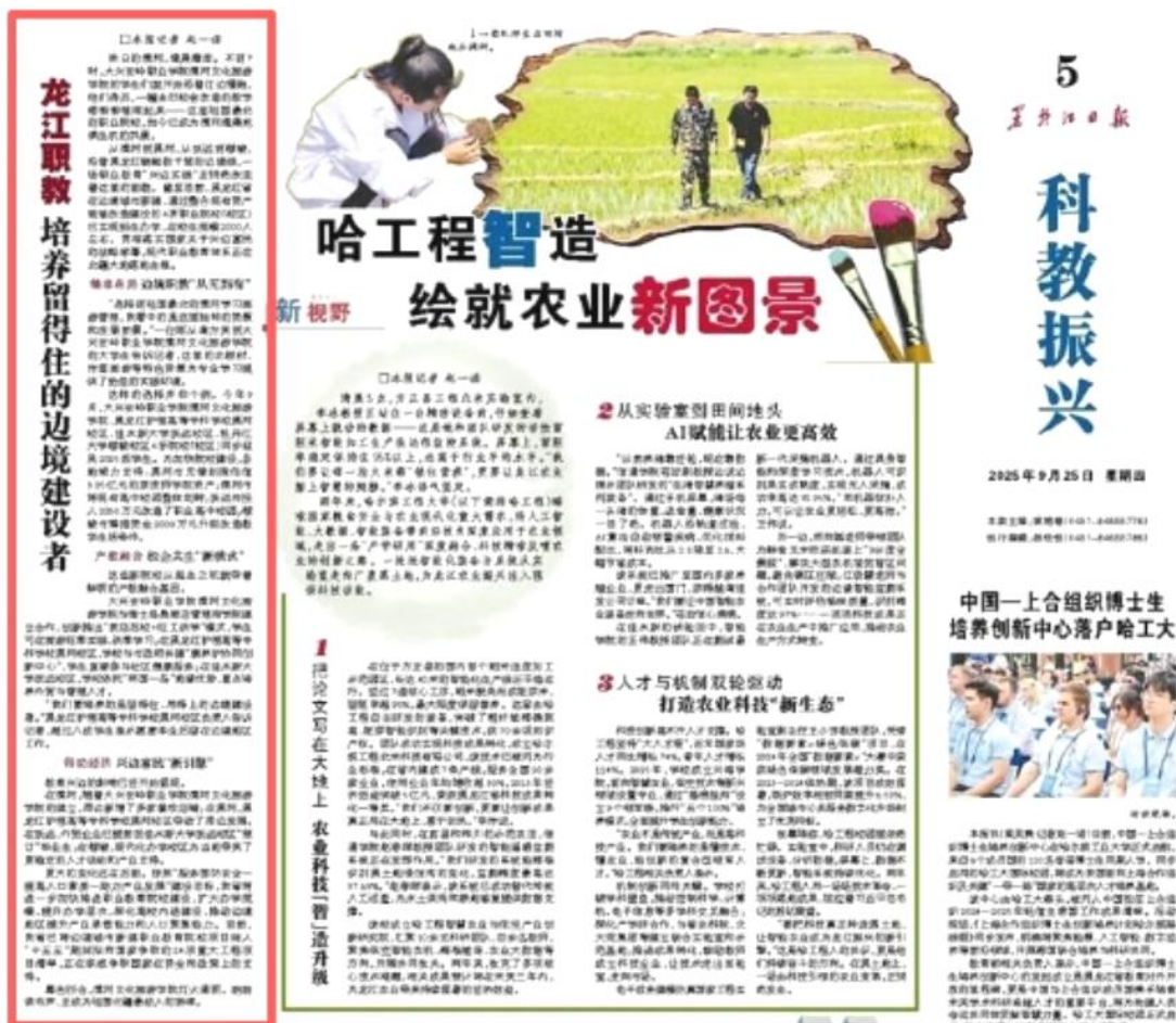
图 7-2 “龙江职教 培养留得住的边境建设者”发表于黑龙江日报