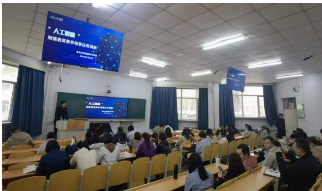
图 8-2 AI 学校开展教师工作坊专题培训