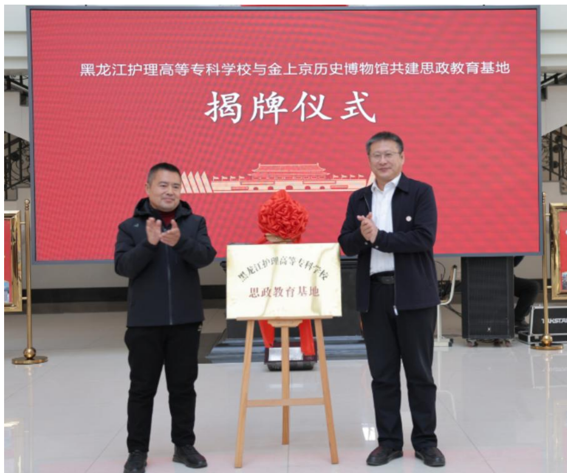
图 2-2 学校与金上京历史博物馆共建思政教育基地揭牌仪式