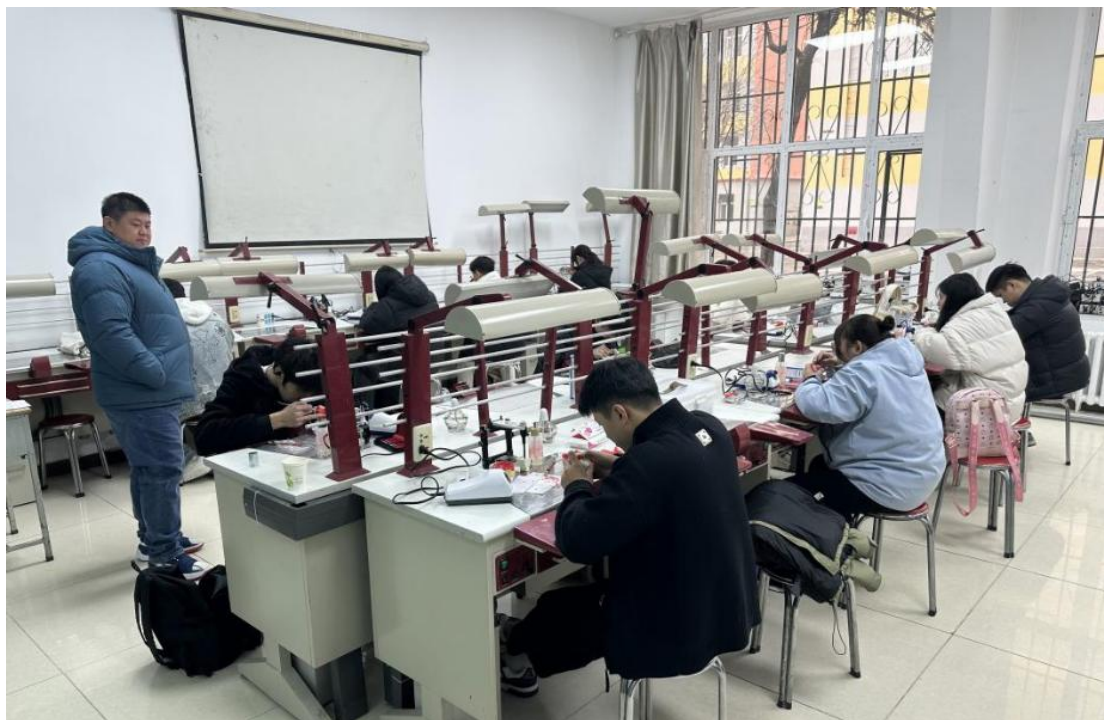
图 7-1 “3+2”中高职贯通培养转段考核口腔医学技术考场