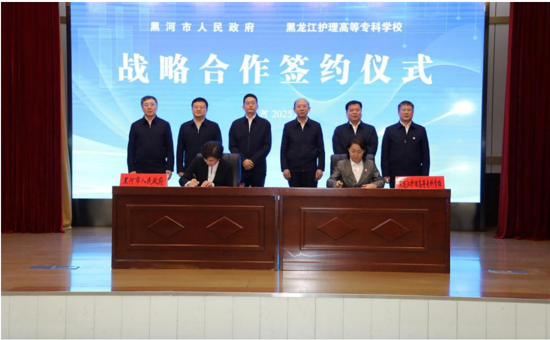
图 3-1 黑河校区共建战略合作签约仪式

为贯彻落实习近平总书记关于“支持在边境城市新建职业院校”重要指示精神的实际行动，2025 年 4 月 17 日上午，黑龙江护理高等专科学校与黑河市政府举行签约仪式，共同签署共建黑河校区战略合作框架协议。这次共建黑河校区是市校双方聚力推动区域发展和教育发展提档扩容升级的全新起点。黑龙江护理高等专科学校将充分发挥教育、技术、人才三位一体优势，在人才培养、科学研究、业务培训、社会服务、国际交流等方面形成全方位、宽领域、多层次的合作关系，共享发展机遇，共同打造深度融合、同频共振的市校合作典范。双方将在人才培养、实验实训、科学研究等方面进一步深化合作，加速构建“产学研用”深度融合体系，不断丰富校地共建、校城相融、产教融合的应用场景，全面推动教育教学质量和医疗服务水平“双提升”。