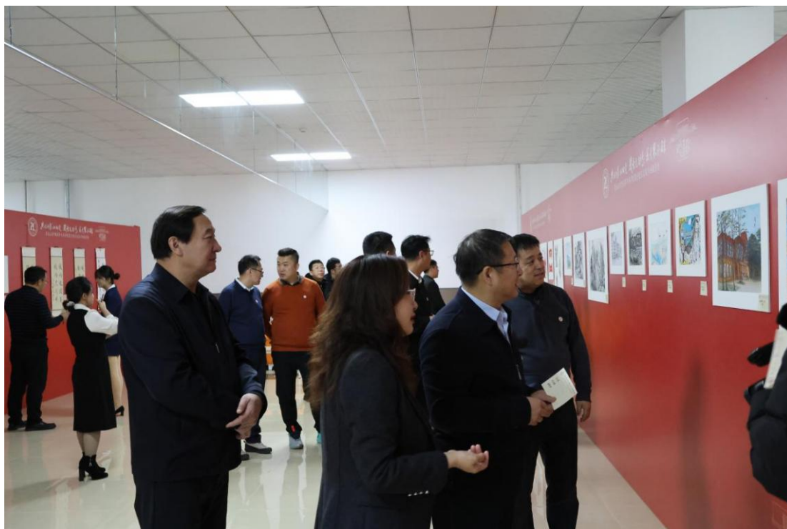
图 4-6 笔墨绘初心、光影映天使—学校首届书画摄影展隆重启幕