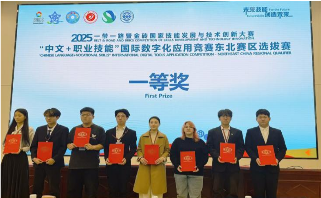
图 5-4 龙护专学子闪耀“中文+职业技能”赛场

本次赛事共吸引全国 480 所院校的 2000 名选手报名参赛。备赛期间，14 名参赛学子凝心聚力，从中文应用能力的精准打磨到专业技能的反复实操，从团队协作的默契磨合到临场应变的模拟演练，在一次次练习与复盘中共克难关。赛场上，学子们沉着冷静、从容应战，凭借扎实的中文功底与娴熟的操作技能，在众多强手中崭露头角。