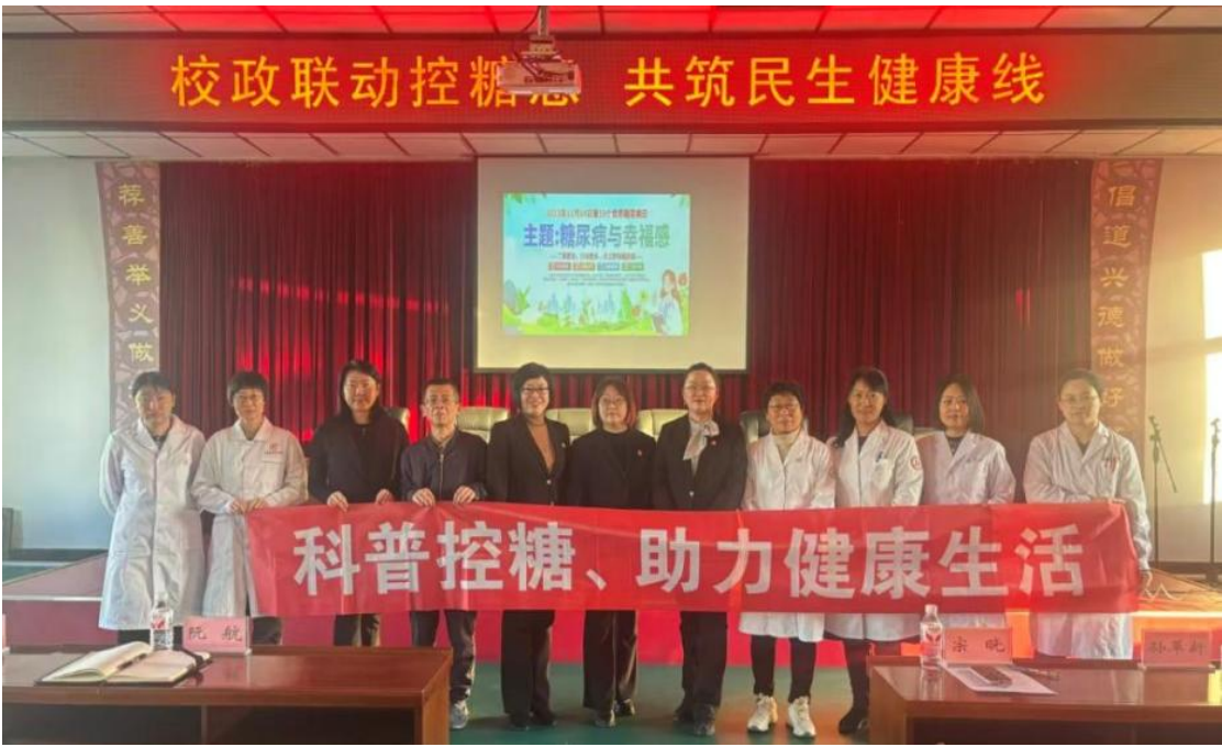
图 2-16 学校联合抚顺街工委开展“世界糖尿病日”健康宣教活动

为响应世界糖尿病日号召，学校护理系、检验系联合抚顺街道党工委及社区卫生服务中心，开展“世界糖尿病日”健康宣教专项活动。活动中，专业教师围绕糖尿病诊断、饮食运动调控、居家用药安全等主题开展宣讲，结合临床案例拆解专业知识；同时提供指尖血糖测定、一对一健康咨询等服务，精准对接社区居民健康需求。有效普及糖尿病防治知识、提升居民健康管理意识，是学校深化校地党建联动、发挥专业优势服务民生的生动实践，既践行了健康中国战略，也让师生在服务中锤炼专业技能、厚植责任担当。