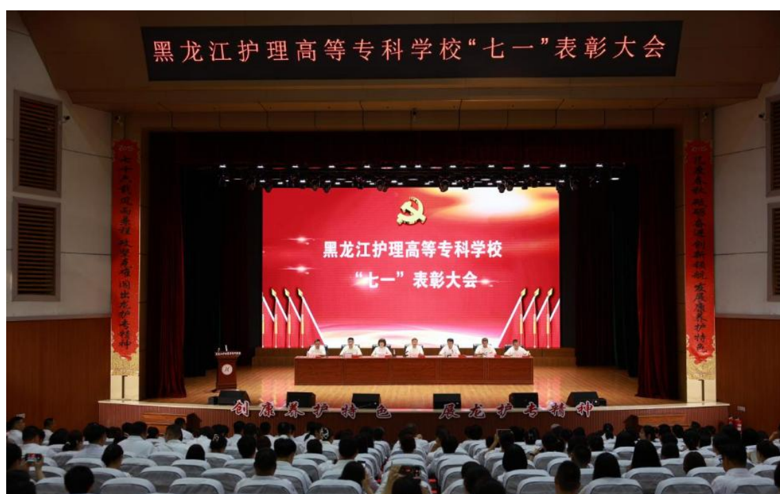
图 2-1 黑龙江护理高等专科学校“七一”表彰大会

体系筑基、价值引领实践赋能、心理文化共育暖心”为核心路径，构建全方位、多层次的育人格局。通过深化党建与思政教育融合、强化红色与科学家精神浸润、完善心理健康与校园文化协同机制，将价值塑造、知识传授与能力培养紧密结合，引导学生树立正确的世界观、人生观、价值观，厚植医学人文素养与职业精神，为培养德技并修的卫生健康人才筑牢思想根基与成长保障。