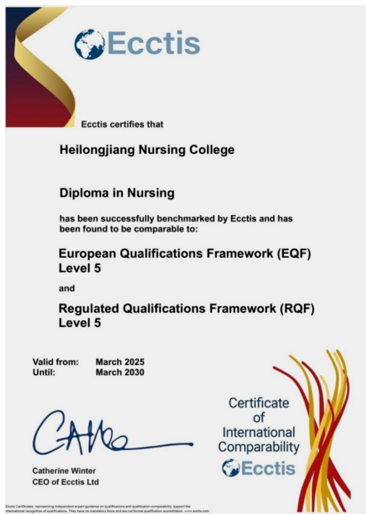
图 5-2 护理专业国际专业标准评估认证