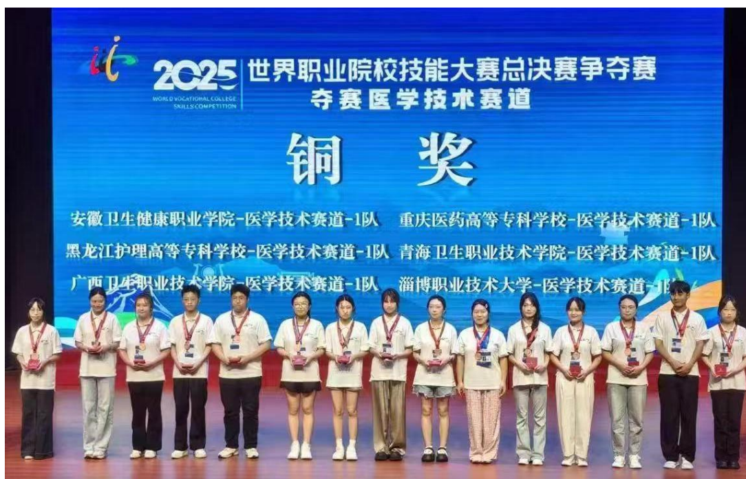
图 3-3 2025 年世界职业院校技能大赛总决赛争夺赛医学技术赛道铜奖