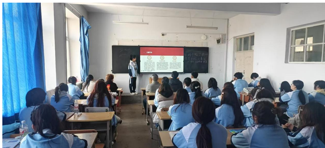
图 4-3 临床医学系在教学中开展学生解读科学家精神活动

传魂”为思路，构建红色思政教学资源体系。系统梳理于维汉院士攻克克山病、边疆战地医护支援等红色医疗故事，将其转化为适配不同课程的教学素材，融入专业课程。同步开发红色案例教学资源库，配套教学设计方案、视频讲解、互动讨论题等资源，供教师灵活运用。通过“案例导入—精神解读—专业对接”的教学模式，让学生在学习专业知识时，同步感悟红色医疗精神，实现知识传授与价值引领的同频共振，有效提升思政育人的针对性与实效性。