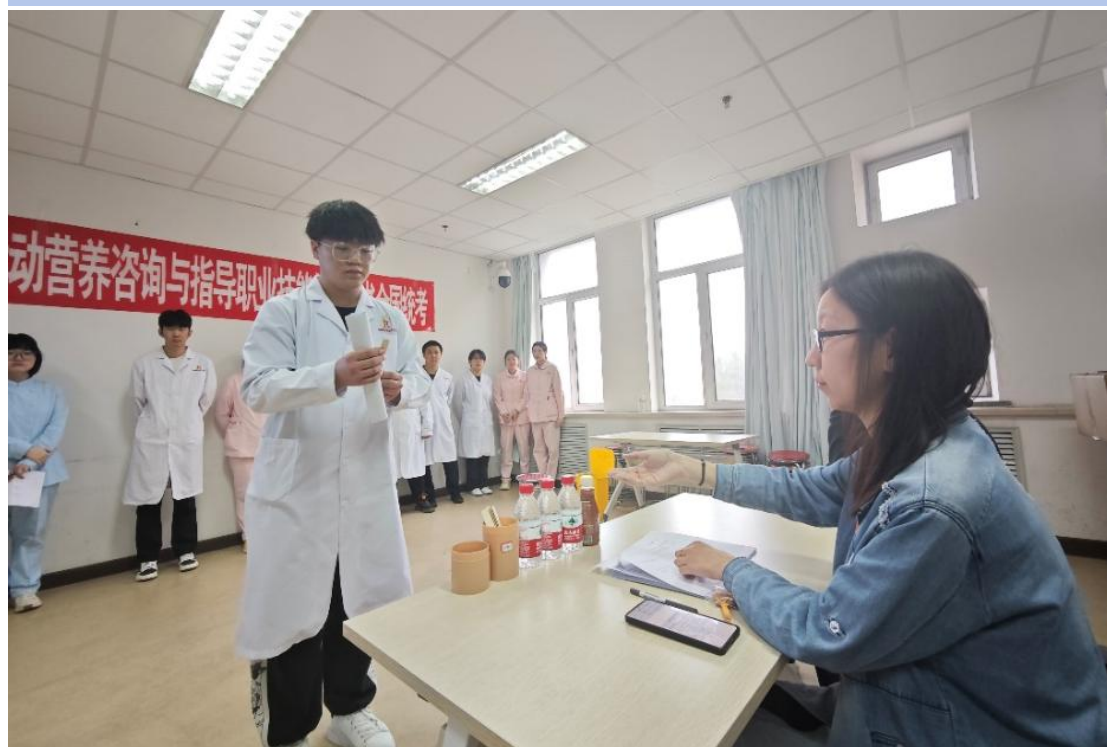
图 2-13 学校获评 1+X 运动营养咨询与指导技能等级证书考试优秀试点院校

学校 2025 年持续推进“1+X”证书制度试点，全年举办 7 个项目中高级考试，2453 名师生参与；继续教育部携手临床医学系等，组织 418 名学生参加运动营养咨询与指导考核，提供数字资源与线下辅导，8 位专业教师开展理论教学与实操指导。最终该项目考试通过率 100%，学校在全国 145 所院校中脱颖而出，获“2025 年度 1+X 运动营养咨询与指导职业技能等级证书考试优秀试点院校”称号，同时多项目高通过率推动“课证融通”与“三教”改革落地。