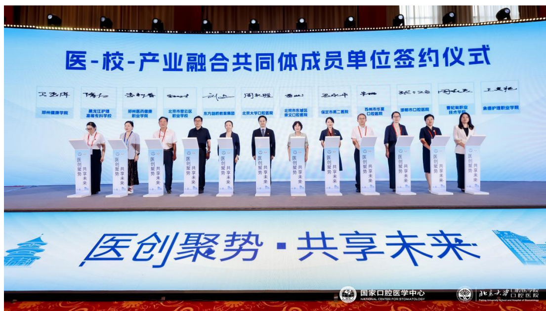
图 6-2 医-校-产业融合共同体成员单位签约仪式