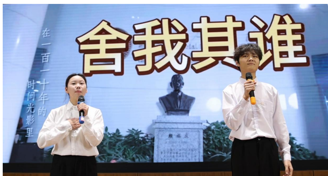
图 4-9 天使校园文化建设系列活动之“立报国强国大志向，做挺膺担当奋斗者”朗诵比赛

学校以“传承中华文脉、赋能康养育人”为核心，构建“课程融文化、活动传精髓、技能践传统”三位一体的中华优秀传统文化传承体系。聚焦传统文化与康养领域的深度融合，通过课程设置夯实文化认知基础，依托特色活动营造浓厚传承氛围，借助实训教学强化技能转化能力。同时，结合黑河校区稳边固边功能，将传统康养文化与边疆群众健康需求对接，推动中华优秀传统文化从校园传承走向社会服务，既丰富了康养专业人才培养内涵，也为职业本科层次传统文化育人模式探索奠定基础。