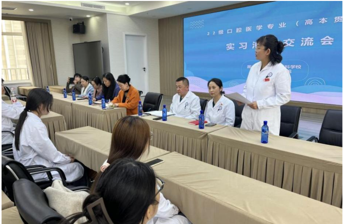
图 2-17 口腔医学专业（高本贯通）组织召开校、院、生三方实习汇报交流会