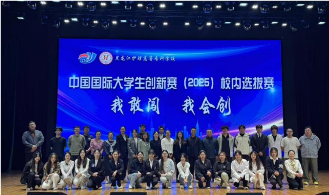
图 2-15 中国国际大学生创新赛（2025）校内选拔赛

以中国国际大学生创新大赛为抓手，深化创新创业教育改革，举办 2025 年校内选拔赛，以“我敢闯我会创”为主题，聚焦新医科、新工科领域助力“健康中国”战略。赛前通过专题辅导会、专家“面对面”问诊点评等方式打磨项目，47 支团队经初赛、复赛层层筛选，12 个优秀项目晋级决赛。邀请多所高校及企业专家担任评委，其中企业评委与潜力项目达成落地合作意向。最终《智慧岐黄——AI 赋能中医传承》等 2 个项目斩获一等奖，既展现了学子创业素质与技术水平，又营造了浓厚创新氛围，为学校探索创新创业人才培养新路径、赋能康养护特色发展注入新动能。