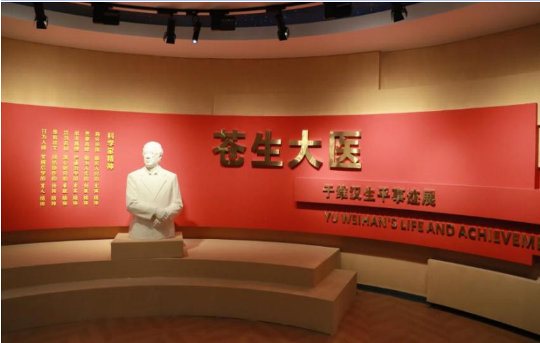
图 4-1 于维汉纪念馆（阿城馆）正式开馆

学校秉持“以文化人、以魂育人”理念，历时 14 个月精心筹建于维汉纪念馆阿城馆，组建专项工作组跨越 10 余个省市，辗转多地征集近千件珍贵文物，涵盖于维汉院士的科研手稿、实验记录、用过的医疗器械及相关历史资料，全面系统呈现院士毕生致力于克山病防治的艰辛历程与卓越成就。该展馆先后荣获多项省级及国家级教育基地称号，不仅为师生搭建了感悟院士风范、厚植医学人文素养的校内实践平台，更成为面向社会公众传承科学家精神、开展思政教育与医学科普的重要地标，有效拓宽了价值引领与人文教育的实践载体，实现了科研精神传承与立德树人的深度融合。