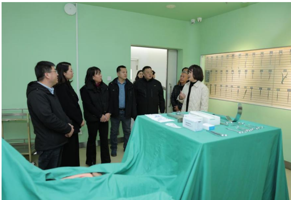
图 2-12 专家组莅临学校多维考察康养护实习实训基地建设

立体考察模式，从多维度评估并提出优化建议。此举不仅展现学校康养护实训基地建设成果，获专家组对规划与保障措施肯定，还为学校细化建设方案、冲击国家级实训示范基地奠定基础，助力龙江康养护产业人才培养。