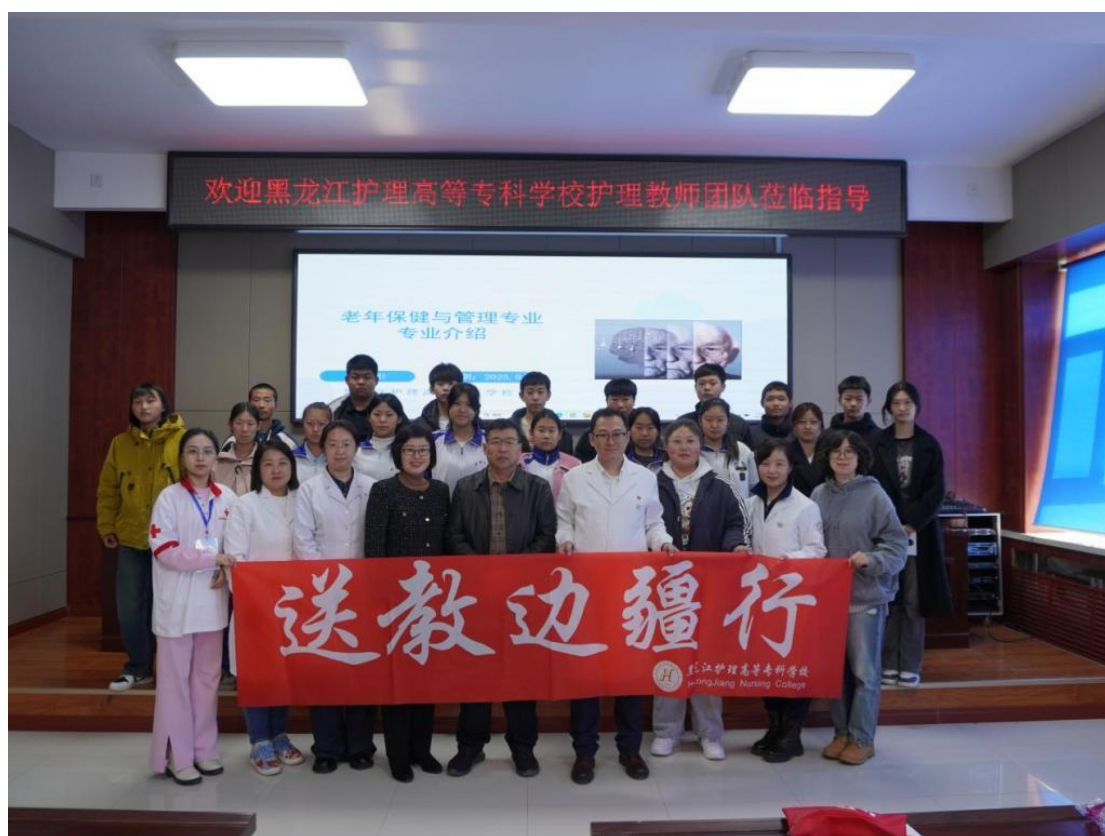
图 4-2 国家级教师创新团队与学校骨干教师赴北安市职业技术教育中心学校开展“北安送教边疆行”活动

2025 年，学校精心组织“重走边疆医疗奋斗路”主题实践活动，推动红色教育从课堂走向实地。活动聚焦黑龙江省北安等革命老区的红色医疗资源，组建由师生党员、专业骨干构成的 7 人实践团队，走访北安地区乡镇卫生院、村卫生室等医疗站点。结合专业特色开展健康宣教、基础诊疗等志愿服务，将红色实践与专业服务相结合，让师生在践行医者使命中深化对红色精神的理解。此次活动不仅丰富了红色教育形式，更强化了师生“扎根龙江、服务边疆卫生健康事业”的责任担当，为后续专业学习与职业发展注入精神动力。