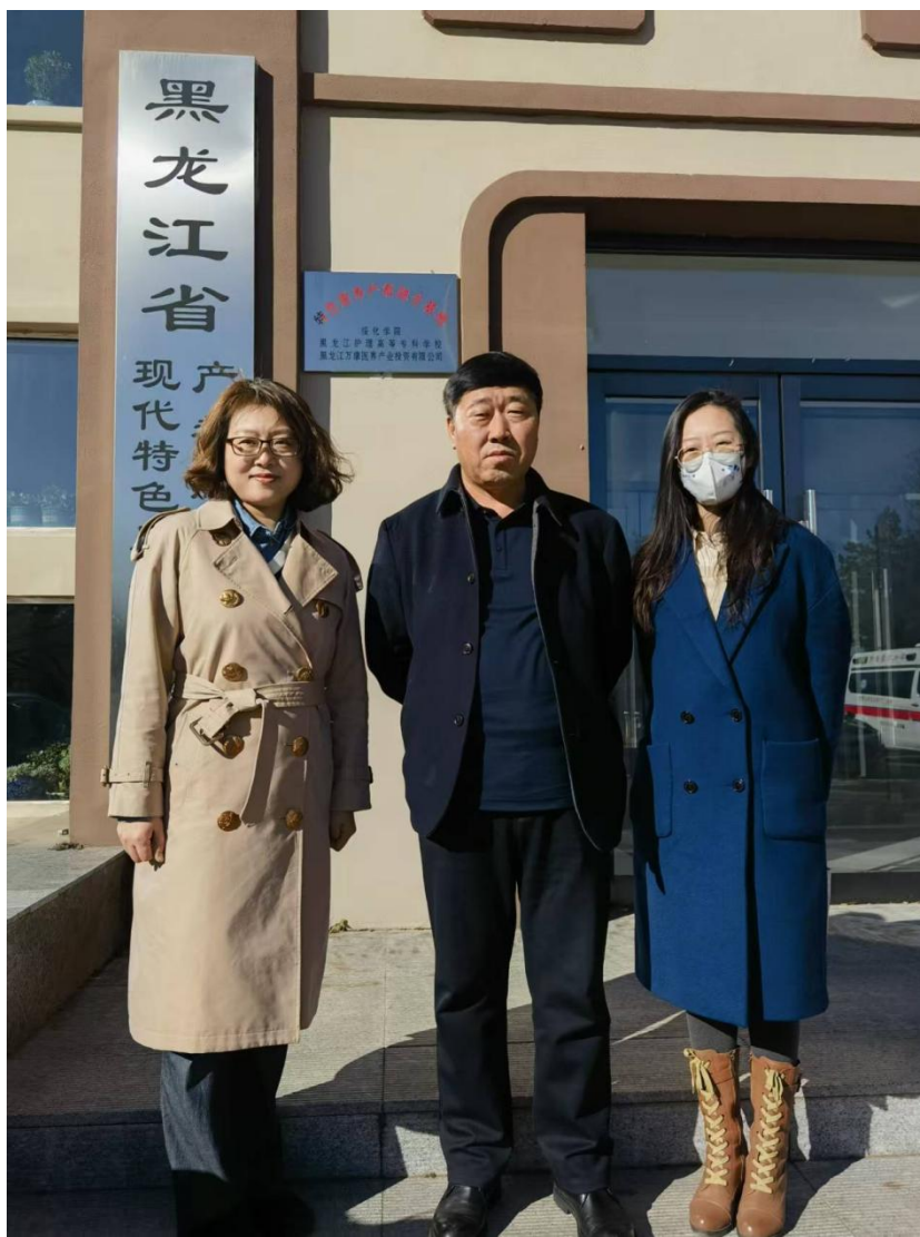
图 6-1 康复医疗系赴绥化万康康复医院、绥化市人民医院开展专项调研