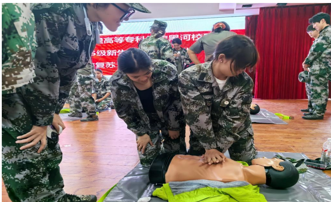
图 3-5 学生在培训中练习急救措施

级新生应急救护培训采取“主课堂+分课堂”相结合的形式开展，由学校红十字应急救护基地师资授课，黑河校区 400 余名新生及军训教官参加活动。将急救教育纳入新生军训是新生入学教育的重要举措，营造了“人人学急救、急救为人人”的良好氛围。此次培训不仅给全体新生带来了一场精彩的应急救护课程，增强了同学们安全意识和自救互救能力，还让 2025 级新生深刻理解了“健康所系，性命相托”的神圣誓言！