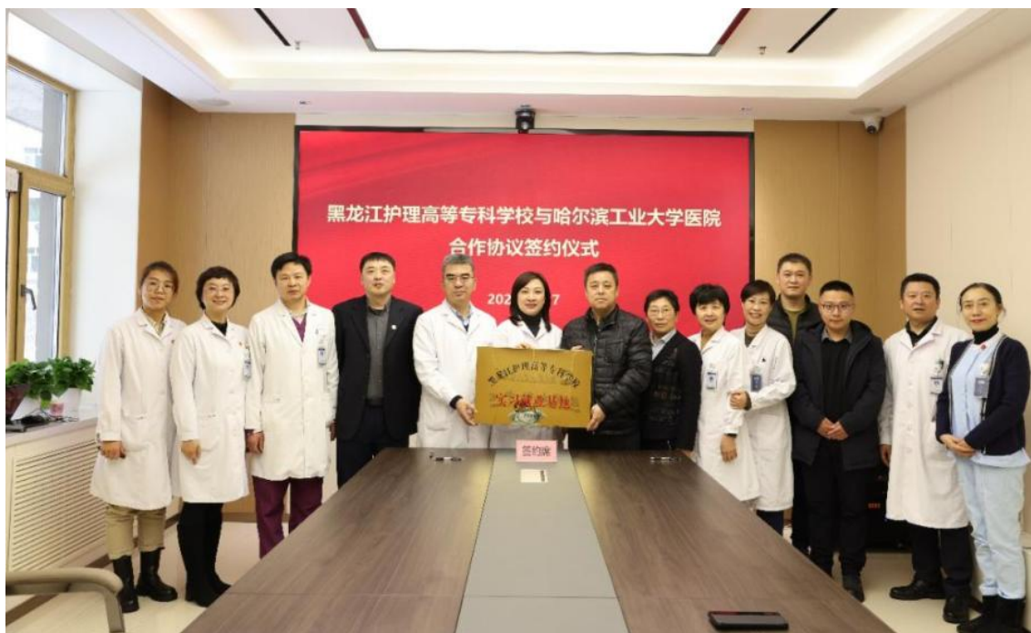
图 2-7 学校与哈尔滨工业大学医院合作协议签约仪式