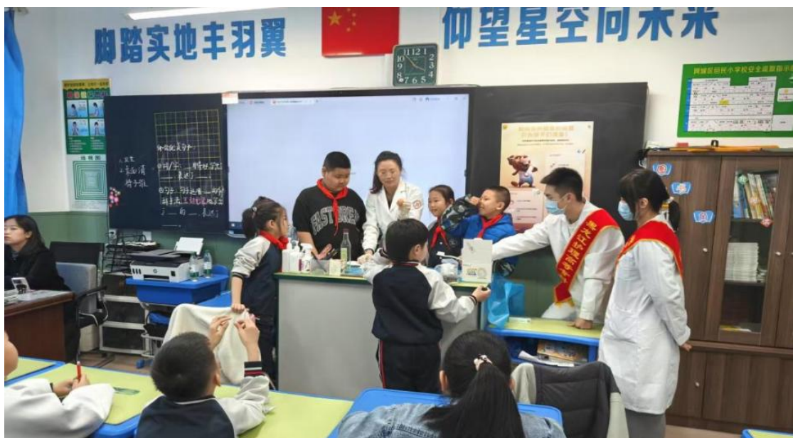
图 8-1 健康口腔推广大使走进阿城回民小学开展主题宣教活动