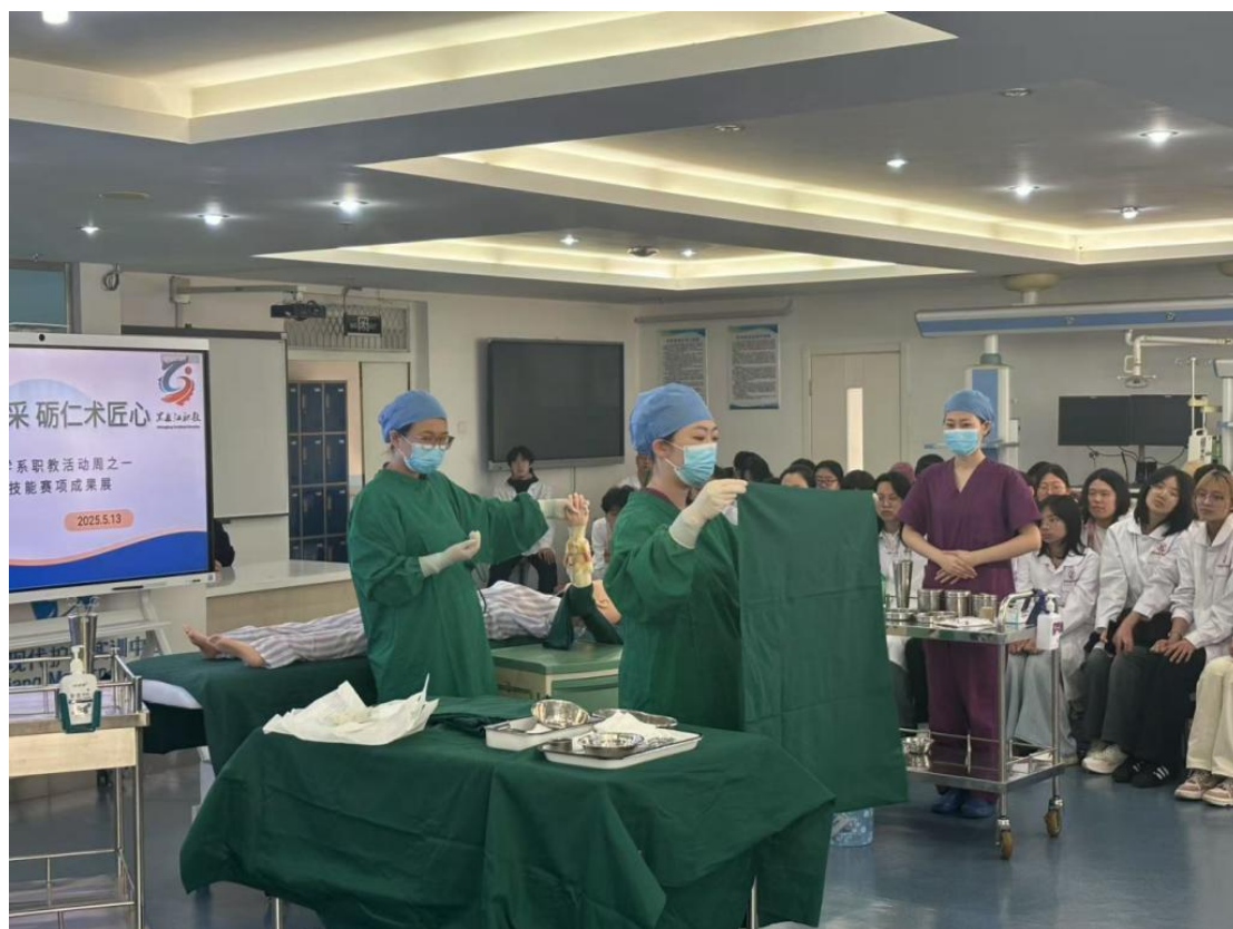
图 4-4 学校 2025 职教活动周系列实践之“薪火相传·筑梦未来”优秀学子经验分享活动

28 场。各部门协同发力，推动工匠精神从理念认知转化为师生的职业自觉与行动实践，为培养适应卫生健康行业需求的高素质技术技能人才筑牢职业精神根基。